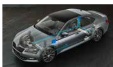
Adaptivní podvozek - volitelné nastavení podvozku ve 3 režimech (Comfort, Normal, Sport)

ŠKODA usnadňuje život svým zákazníkům každý den.