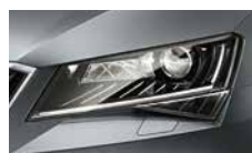
Smart Light Assist - automatické přepínání a clonění dálkových světel