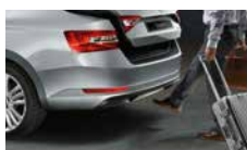
Virtuální pedál - bezdotykové otevření 5. dveří